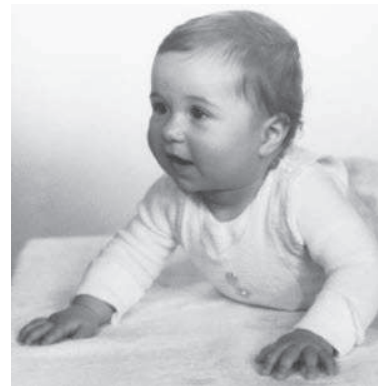
Das bin ich mit 6 Monaten

Meine Familie hat das erste Stockwerk eines alten Bauernhauses bewohnt. Im Winter war es in unserer Wohnung immer kalt, weil die alten Kachelöfen nicht mehr richtig geheizt haben. Wenn es sehr kalt war, hat mein Vater abends einen Ziegelstein in die Glut eines Ofens gelegt bis er richtig heiß war, dann hat er ihn mit einer Zange wieder herausgenommen und in Zeitungspapier eingewickelt und kurz vor dem Schlafengehen unter die Bettdecke gelegt. Trotz der Kälte im Zimmer habe ich mich unter der warmen Bettdecke immer geborgen gefühlt.